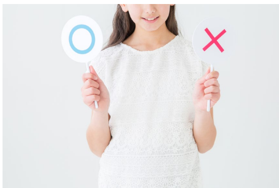
イベント会社のクイズの 答えとして