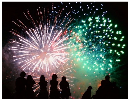
花火大会の開催連絡