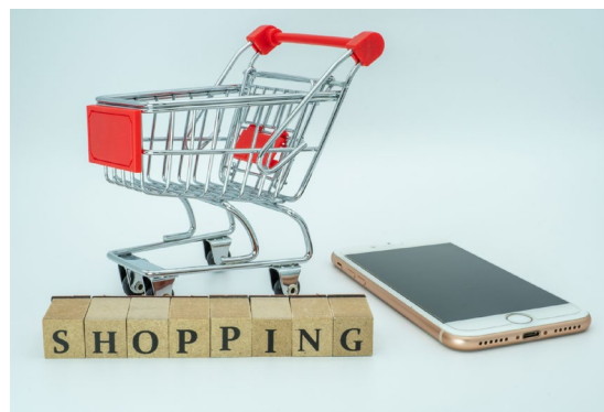
WEBショップの 連絡先として