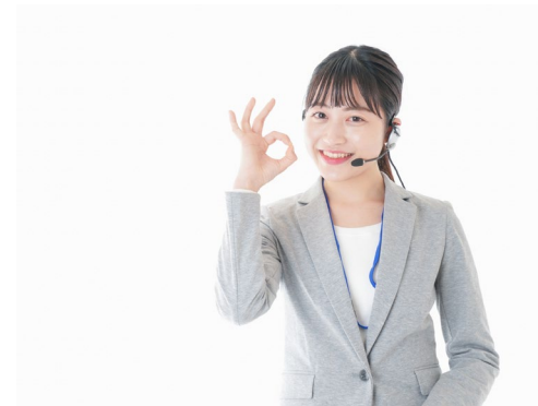
有料情報サービスの 情報提供