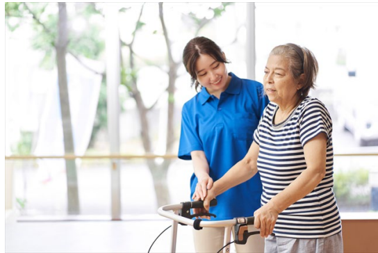
介護施設の営業時間外の 連絡先の案内として