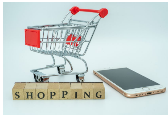
WEBショップの 連絡先として