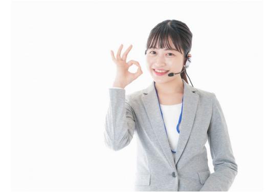
有料情報サービスの 情報提供